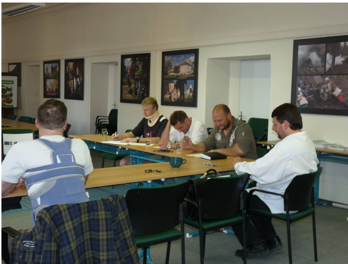
Foto ze setkání