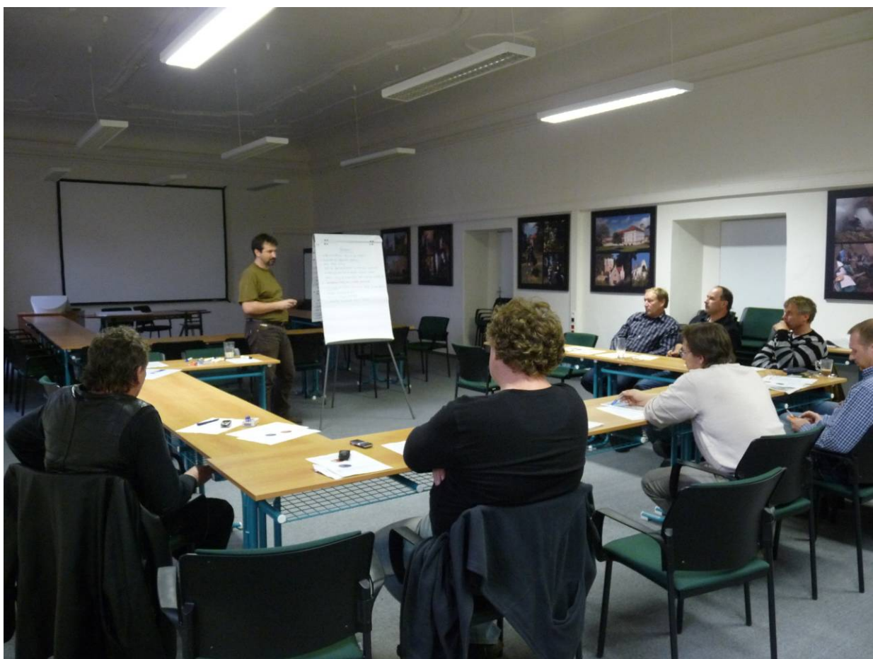
Foto ze setkání