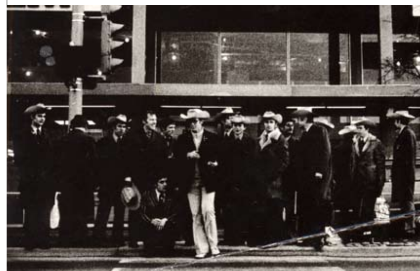
^ 1971/72: Dukla Jihlava jako první československý klub v historii reprezentovala zemi na Světovém poháru v USA.