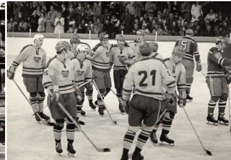
^ 1971/72: Na Světovém poháru v USA obsadila Dukla 3. místo.