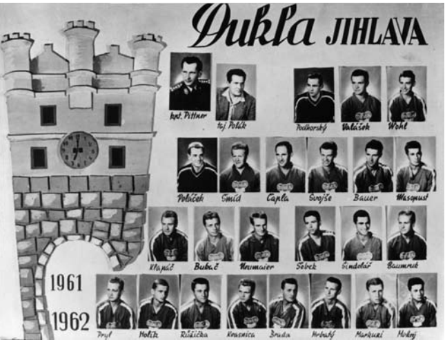
^ 1961/62: Tablo s podobenkami hráčů bylo pro Duklu v jejích prvních letech typické.