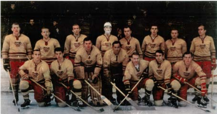
^ 1966/67: Tento tým vybojoval pro Jihlavu historicky první titul mistrů ligy.