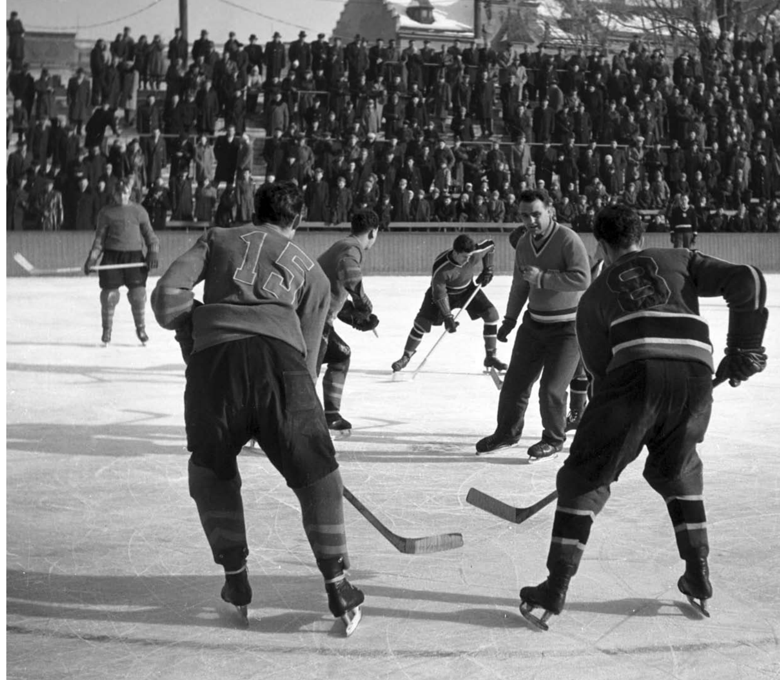
1958/59: Dukla první sezony odehrála na tehdy ještě otevřením Horáckém stadionu.