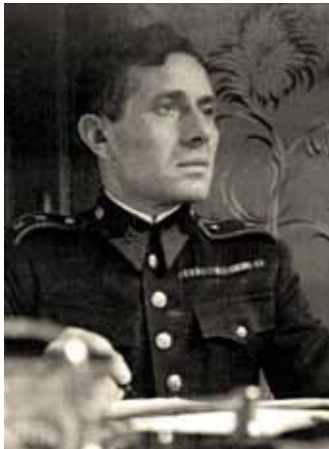
Jeden z nejznámějších představitelů ilegální odbojové organizace Obrana národa Josef Balabán (na snímku v hodnosti majora), generálmajor in memoriam, strávil část života na Dobříšsku a Sedlčansku. Byl popraven v rámci I. stanného práva dne 3. 10. 1941 v Praze-Luzni.