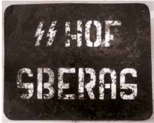
Plechová tabulka z SS-Hofu Zberaz, uchovaná v Městském muzeu Sedlčany.

Tak se snažila vysvětlit obyvatelstvu vznik cvičiště protektorátní vláda v prohlášení, které vyšlo 7. června 1943. Proč ale tehle osud potkal právě