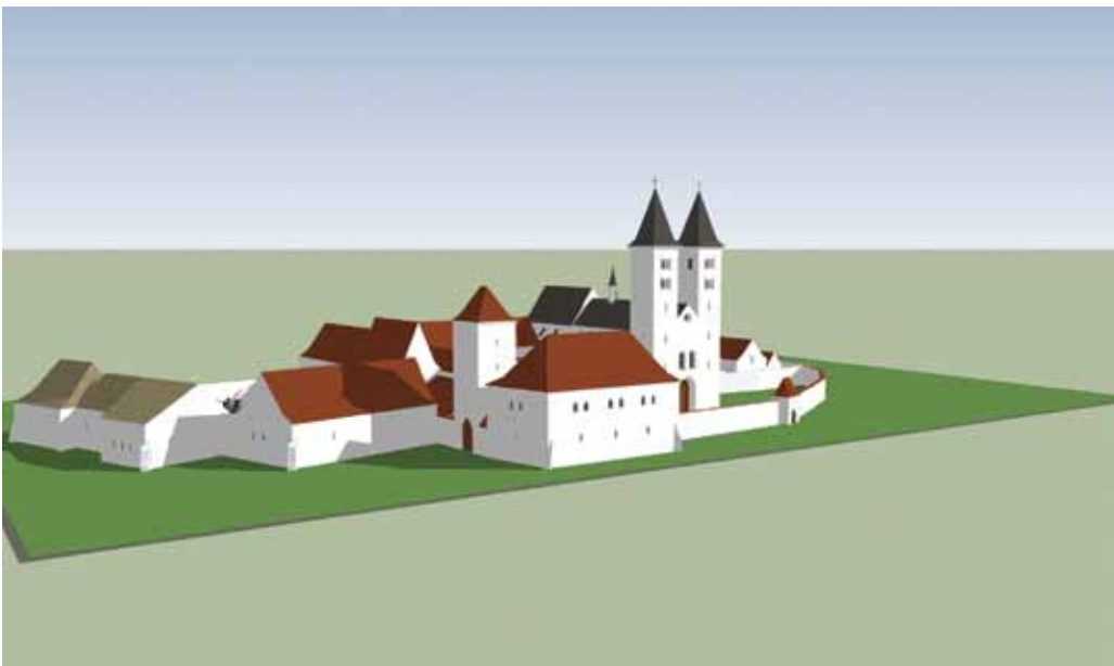
Ukázka vizualizace kláštera na Ostrově. Archiv muzea.

Díky grantové pomoci Ministerstva kultury ČR, společnosti Mitsubishi Corporation a s podporou Středoeckého kraje vzniká moderně pojetý projekt, který čerpá ze všech dostupných pramenů i výsledků bádání několika vědních oborů. Zároveň v nové expozici hodlá jílovské muzeum využít moderních technik i technologií v rámci přiblížení nejstarší historie regionu jak odborné, tak i nejširší veřejnosti a všem návštěvníckým věkovým kategoriím.