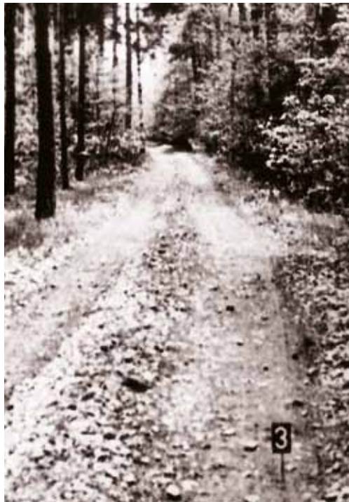
Cesta, kde došlo k hromadnému střelení v dubnu 1945.

Dne 15. září 2012 byla u příležitosti 70. výročí vystěhování otevřena naučná stezka „Vystěhovaní Hradištko“. Stezka začíná na návsi u záměcku a v délce 8,5 km vede zajímavými místy spjatými s historií za druhé světové války. 10 zastávek připomíná přeměnu obce ve vojenské cvičiště, koncentrační tábor a osudy vězňů, vyzvednutí stěchovického archivu i návrat občanů po válce.