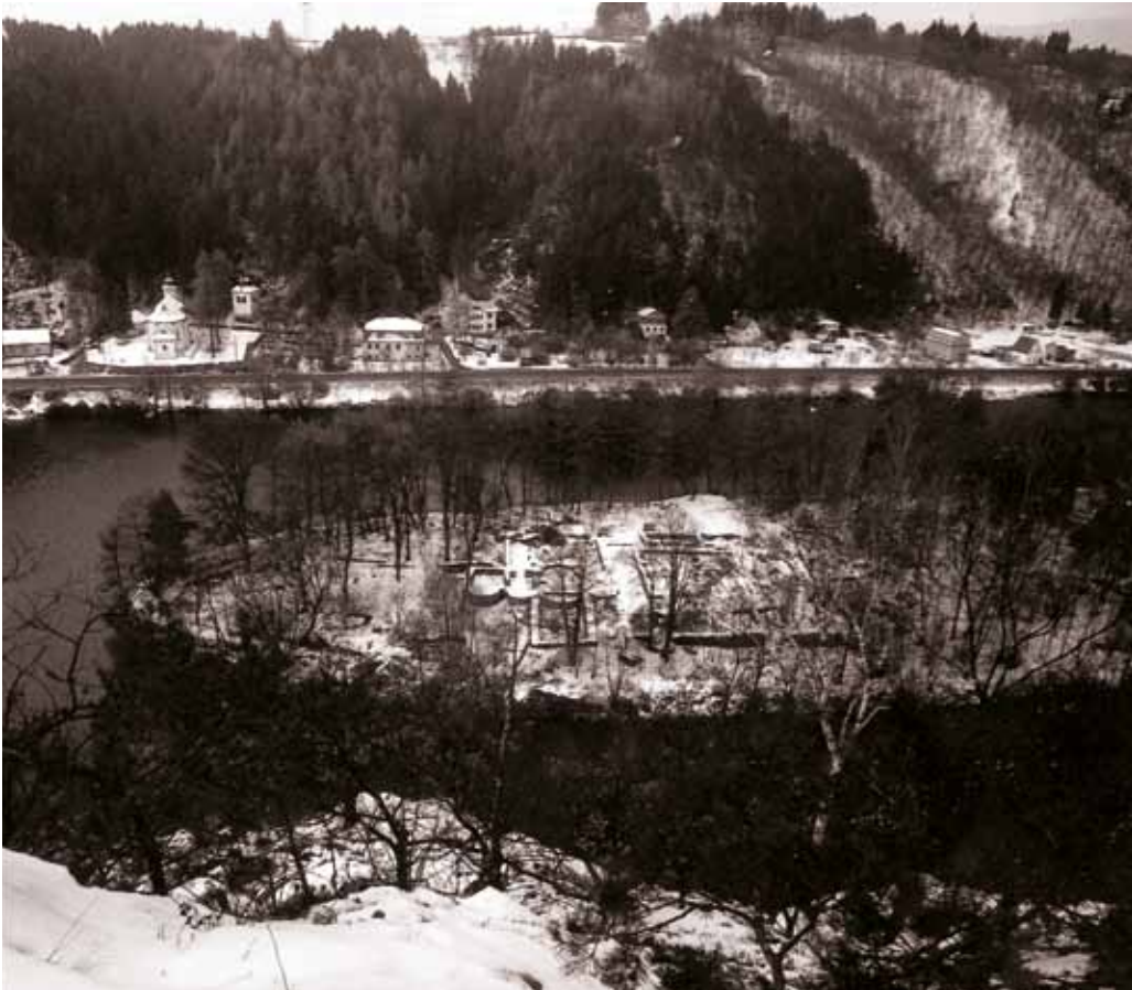
Současnost – klášter na Ostrově a sv. Kilián.

V časové i programové posloupnosti bude představen řád sv. Benedikta a jeho role v počátcích dějin křesťanské Evropy, doba vzniku a rozvoje řeholní komunity na Ostrově, úloha kláštera v kolonizaci jihovýchodních oblastí středních Čech i jako nositele vzdělání a kultury. Formou patnáctiminutové filmové projekce z vizualizačního 3D programu budou představeny jednotlivé stavební fáze a podoby kláštera i vzhled sídlíště na Sekance před jeho zánikem. Tato velkoplošná projekce bude mít charakter virtuální prohlídky obou lokalit.