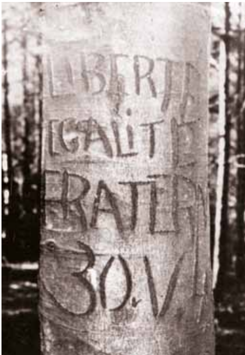
Strom s vyrytými hesly Velké francouzské revoluce.