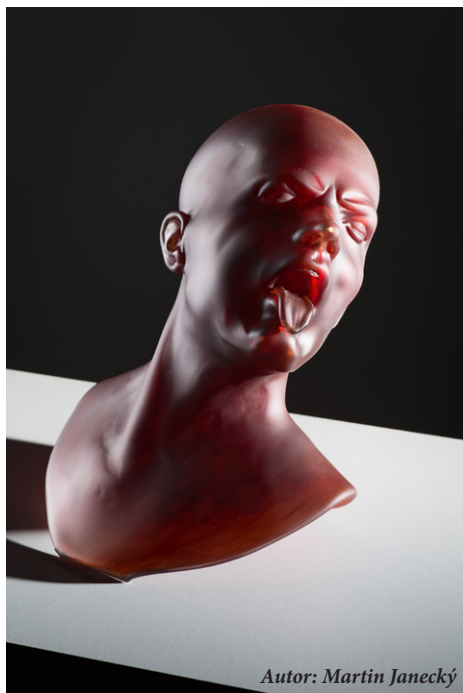
Autor: Martin Janecký

Ateliérové sklo předních českých i zahraničních výtvarníků vytvořené v letech 2014 až 2016 v Centru sklářského umění Huť František v Sázavě představí výstava nazvaná Skleněné poklady, která začne 29. září v historickém Mázhausu Novoměstské radnice v Praze na Karlově náměstí. V rámci jejího ukončení se 13. října od 19.00 hodin uskuteční komentovaná prohlídka výstavy a benefiční aukce všech vystavených děl. Výtěžek podpoří vzdělávací aktivity dětí a mládeže realizované v sázavském Centru sklářského umění a část půjde také na podporu dětí ze sázavského Dětského domova.