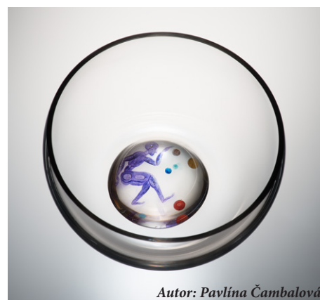
Autor: Pavlína Čambalová

léta a řadí se mezi ně objekty a vázy Ondřeje Novotného, váza nizozemského skláře Christiaana D. Maase či benátská číše Martina Štefánka.