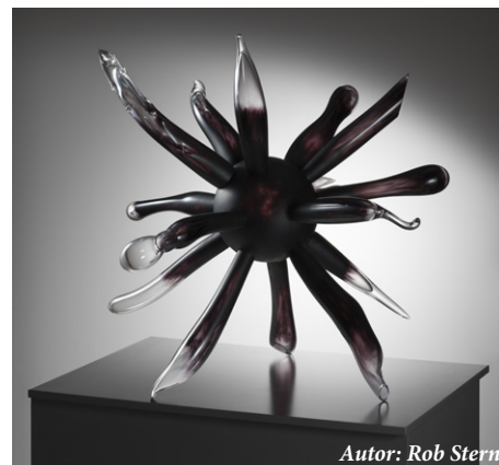
Autor: Rob Stern

„Nejmladší“ Skleněné poklady vznikly během letošního, již tradičního, Skleněného