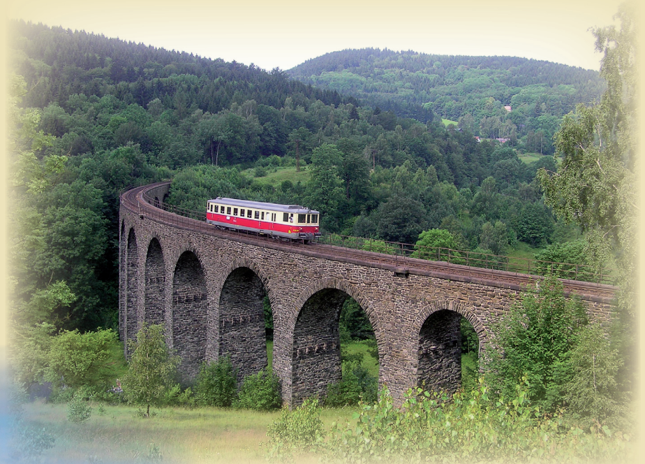
Jízdní řád Kamenický motoráček 2011