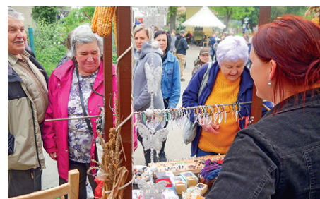
Pod moruší, Cesta venkova, Pivovar Ferdinand nebo Domácí bylinkové výrobky...