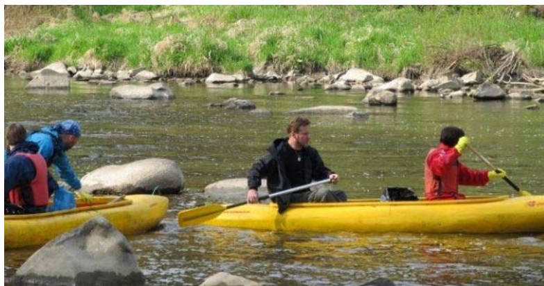
Dobrovolníci čistí koryto a břehy řeky Sázavy. Někteří přímo z lodí