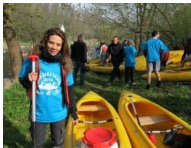
Dobrovolníci čistí koryto a břehy řeky Sázavy. Patronkou akce je zpěvačka Aneta Langerová

Poprvé dobrovolníci uklízeli řeku Sázavu v roce 2006, a to mezi Sázavou a Pikovicemi, kde nasbírali 12 tun odpadků. O rok později se koryto řeky čistilo už z Kácova do Pikovic, kde se sesbíralo 18 tun odpadu.