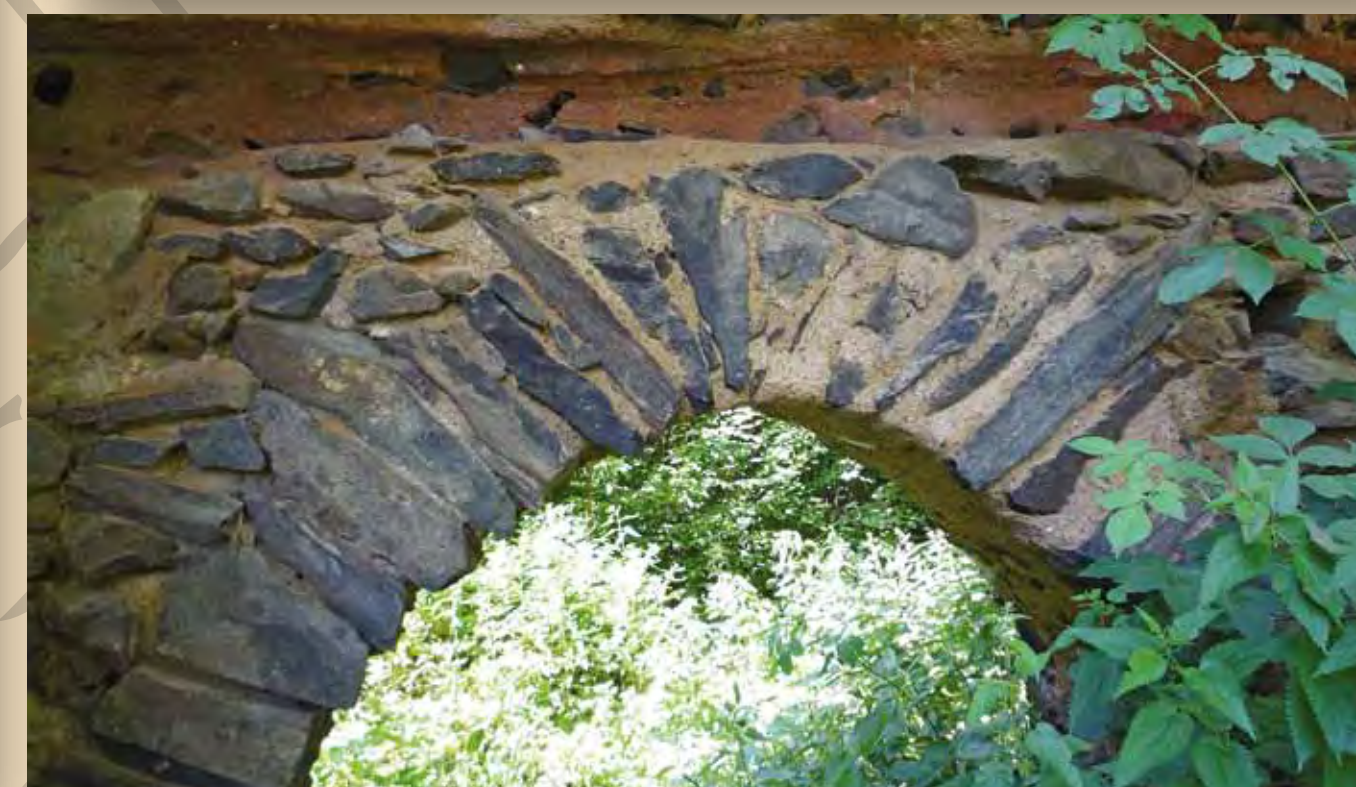
Ondřej z Dubé

Nejvyšší sudí Českého království a znalec starého zemského práva. Oddaně sloužil císaři Karlu IV. a po jeho smrti i Václavu IV. Narodil se v roce 1320 ve Zlenicích u Čerčan ve šlechtické rodině odnože Benešoviců. O jeho mládí a vstupu se moc neví. S historií a zásadami soudnictví se pravděpodobně seznamoval na právnické fakultě, která byla zřízena brzy po založení Univerzity Karlovy. Ondřejovi z Dubé patřil kromě hradu Zlenice také hrad Stará Dubá. Městečko Odranec, které leželo v jeho podhradí a mělo vlastní opevnění, je důkazem, že Ondřejovi nebyla lhostejná ani bezpečnost jeho poddaných.