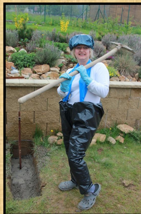
Kšandy (Manutan, 219 Kč)

Naše kolekce také zahrnuje pracovní oděvy. Mundůr využijete na práci venku i na stavbě. Montérky jsou tvarovatelné a voděodolné. Dodáváme ve všech velikostech od XL - až po nadměrné XXXL. Díky pružným fešným kšandám vám nikdy nespadnou.