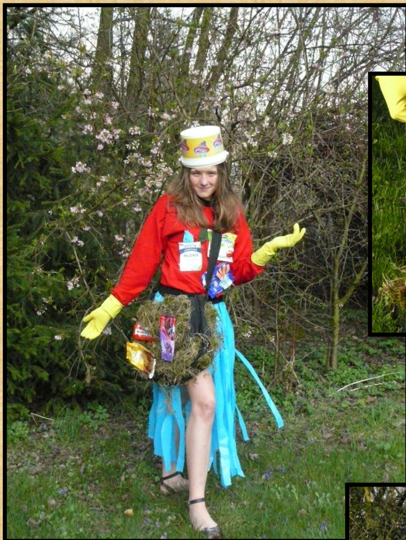
Kabela (New Yorker, 489 Kč)