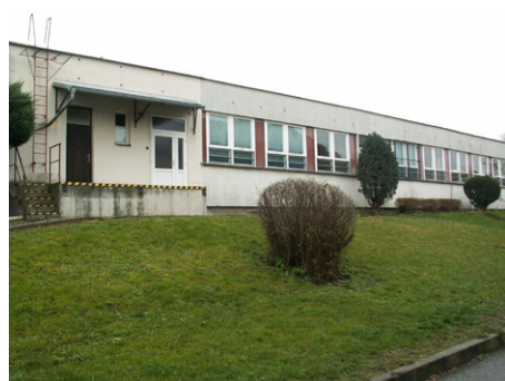
ZŠ Čerčany – současný stav

Město Týnec nad Sázavou pak ze stejného programu ministerstva financí získalo celkovou dotaci ve výši 18,5 milionu korun na přístavbu Základní školy Týnec nad Sázavou. I v tomto případě se jedná o dvouletý projekt, který bude dokončen v příštím roce.