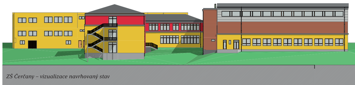
ZŠ Čerčany – vizualizace navrhovaný stav